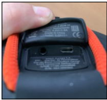
De USB oplaadpoort

1/ Installeer de app “UE Roll” op uw smartphone of tablet.