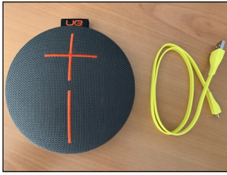
UE Speaker met bijhorende laadkabel.